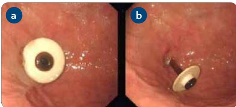
Figur 9: Bilde fra magens innside som viser a) korrekt kontakt mellom stoppeplate og magesekkens slimhinne og b) en stoppeplate som ikke sitter korrekt, og som vil kunne lede til lekkasje av magesaft.